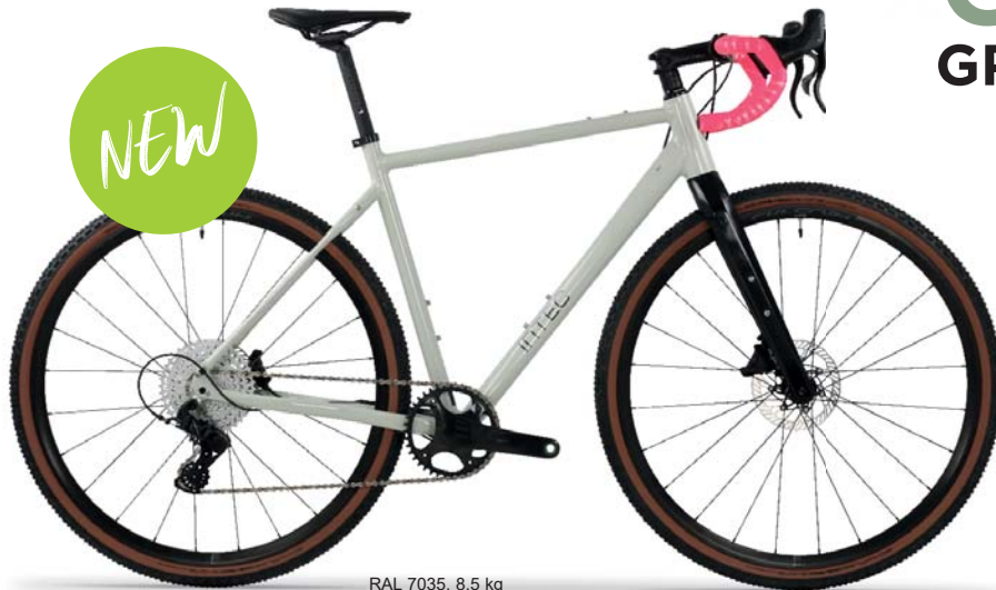
RAL 7035, 8,5 kg