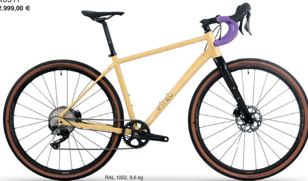
RAL 1002, 9,6 kg