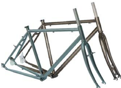
T9 STAHL RAHMEN + GABEL Cantilever only, für ROHLOFF Getriebe Rahmenhöhen: 530|570|610 mm Art.-Nr. T9RSC Cantilever Art.-Nr. T9RSD Disc empf. VK: 839,00 €