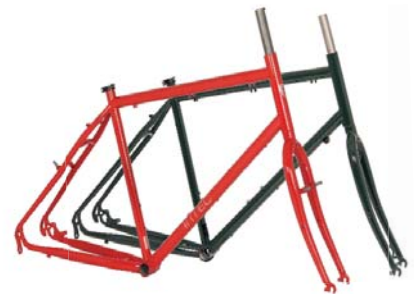
M1 STAHL RAHMEN + GABEL Rahmenhöhen: 420|460|500|540|580 mm Art.-Nr. M1RSC Cantilever Art.-Nr. M1RSD Disc empf. VK: 539,00 €