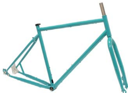
M5 STAHL RAHMEN + GABEL Disc only Rahmenhöhen: 480|520|560|590 mm Art.-Nr. M5RSD empf. VK: 699,00 €