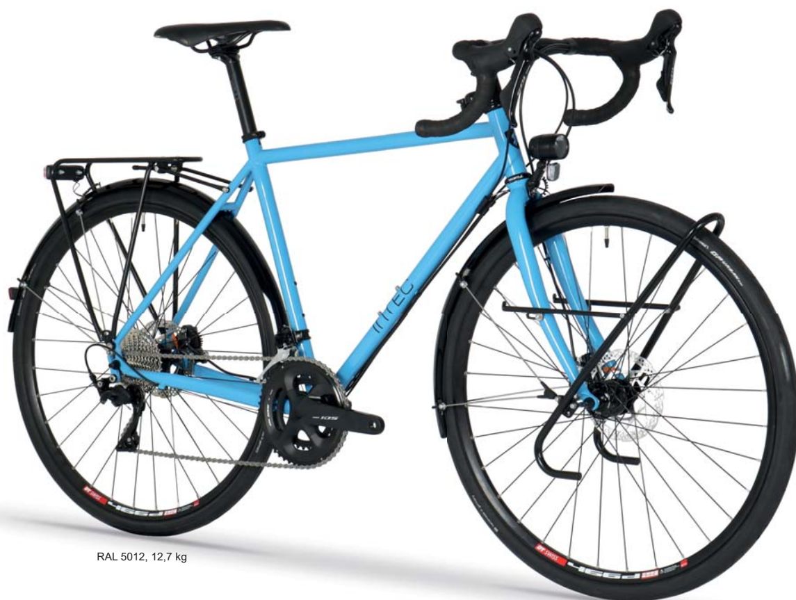
RAL 5012, 12,7 kg