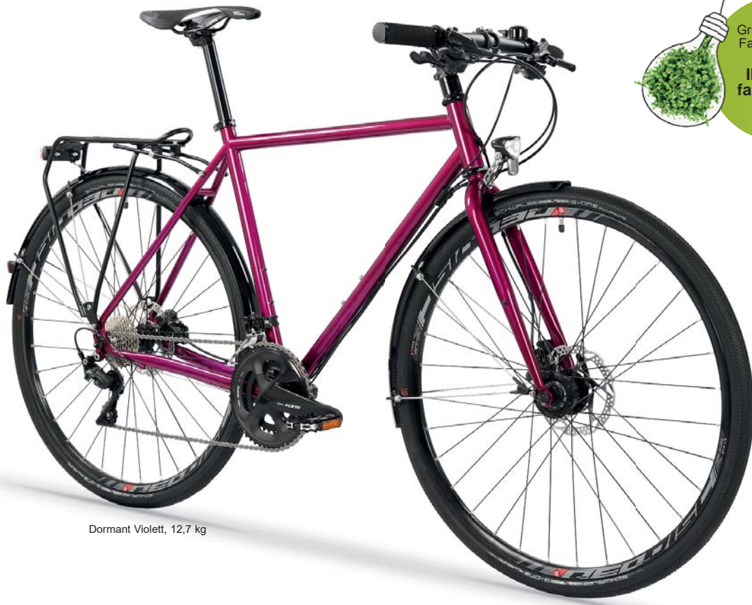
Dormant Violett, 12,7 kg