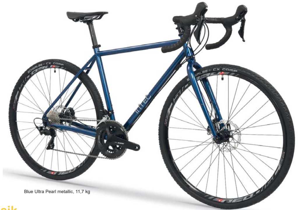
Blue Ultra Pearl metallic, 11,7 kg