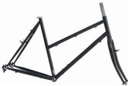
T7 STAHL RAHMEN + GABEL Cantilever only Rahmenhöhen: 420|470|520|570 mm Art.-Nr. T7RSC empf. VK: 569,00 €