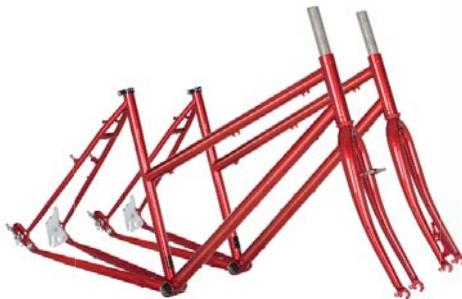
T10 STAHL RAHMEN + GABEL für ROHLOFF Getriebe Rahmenhöhen: 470|520 mm Art.-Nr. T10RSC Cantilever Art.-Nr. T10RSD Disc empf. VK: 839,00 €