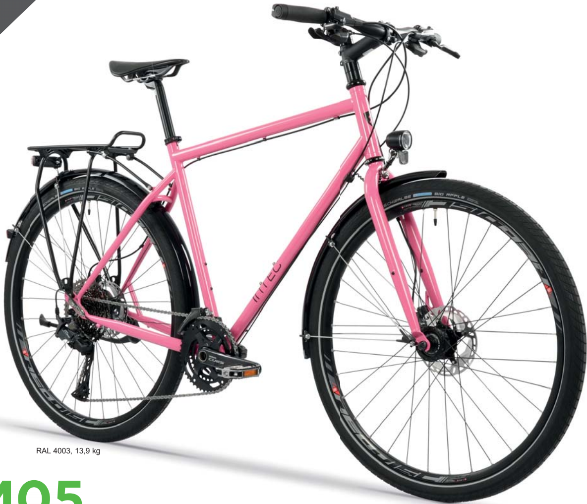
RAL 4003, 13,9 kg