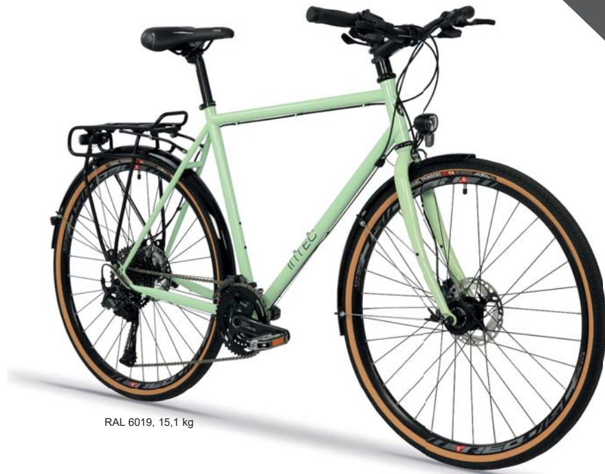
RAL 6019, 15,1 kg

ROHLOFF 14s, rot, Disc Art.-Nr. T09RR0D empf. VK: 3.249,00 €