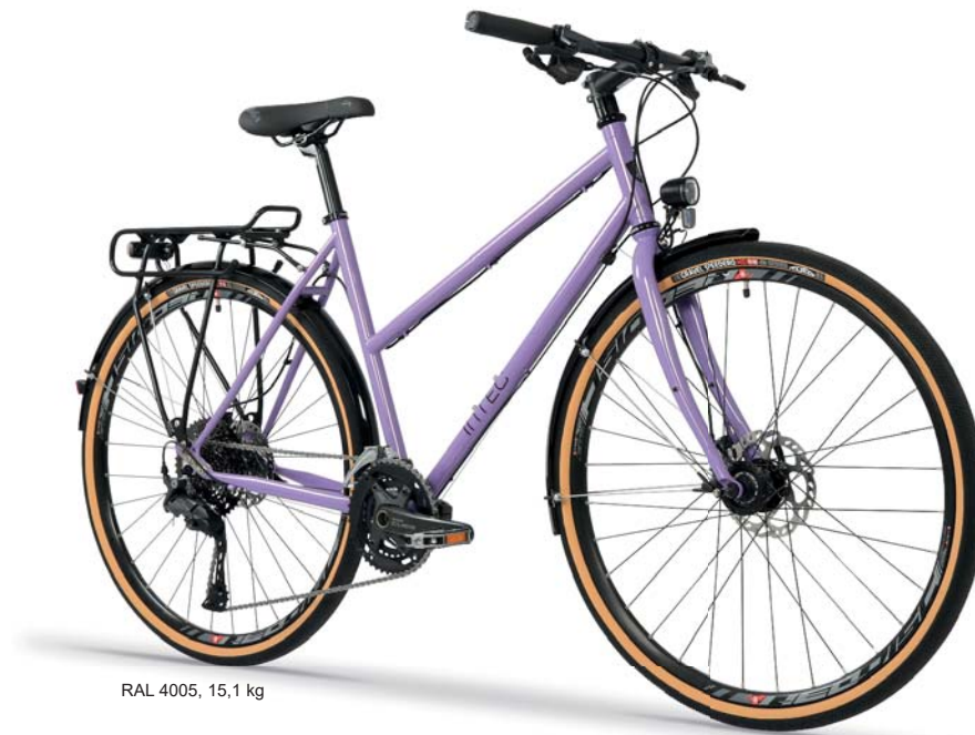
RAL 4005, 15,1 kg

SHIMANO Alfine 8s, schwarz Art.-Nr. T010A8SWD empf. VK: 2.099,00 €