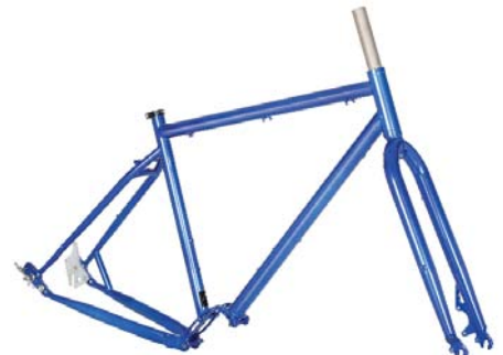
M6 STAHL RAHMEN + GABEL Disc only, für PINION Getriebe Rahmenhöhen: 520|560|590 mm Art.-Nr. M6 empf. VK: 849,00 €