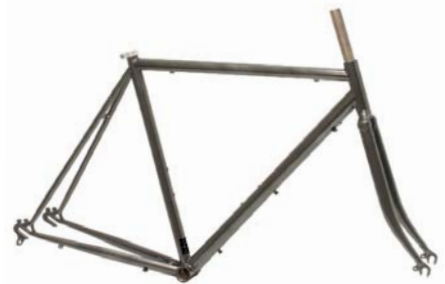
F5 STAHL RAHMEN + GABEL Rahmenhöhen: 520|550|580 mm Art.-Nr. F5RS empf. VK: 599,00 €