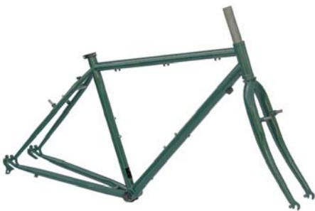
T6 STAHL RAHMEN + GABEL Cantilever only Rahmenhöhen: 490|530|570|610|645 mm Art.-Nr. T6RSC empf. VK: 569,00 €