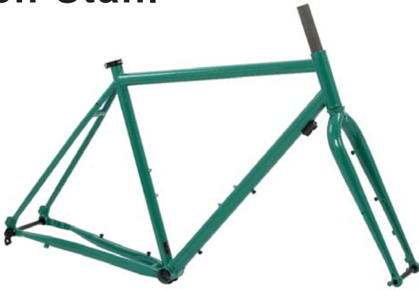
F11 Steiger STAHL RAHMEN 28" + GABEL Disc only Rahmenhöhen: 480|510|540|570|600|630 mm Art.-Nr. F11RS empf. VK: 999,00 €