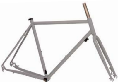
F10 STAHL RAHMEN + GABEL Art.-Nr. F10RSD Disc Rahmenhöhen: 510|540|570|600|630 mm empf. VK: 649,00 €